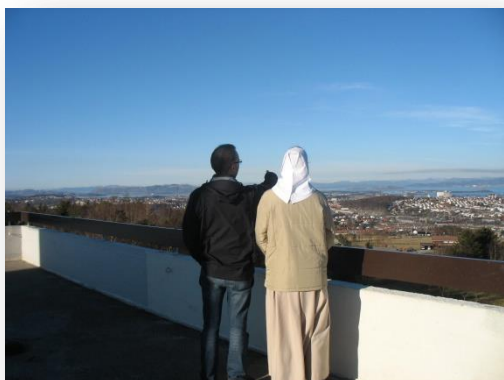
Från resan till sydvästra Norge