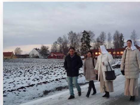
Med iranska vänner på Nationell bönekonferens

© 2016 De Evangeliske Mariasøstre, Opstuen 20, NO-2266 ARNEBERG, NORGE Tel: 0047-62 95 31 02 E-post: mariasostrene@bbnett.no Hemsida: www.evangeliskemariasostre.org Plusgiro i Sverige: De Evangeliska Mariasystrarna 166 08 44 - 0