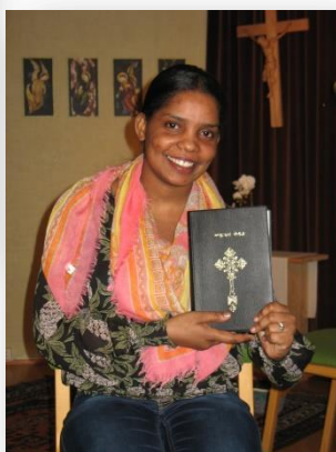
TACK för en Bibel på mitt eget språk!